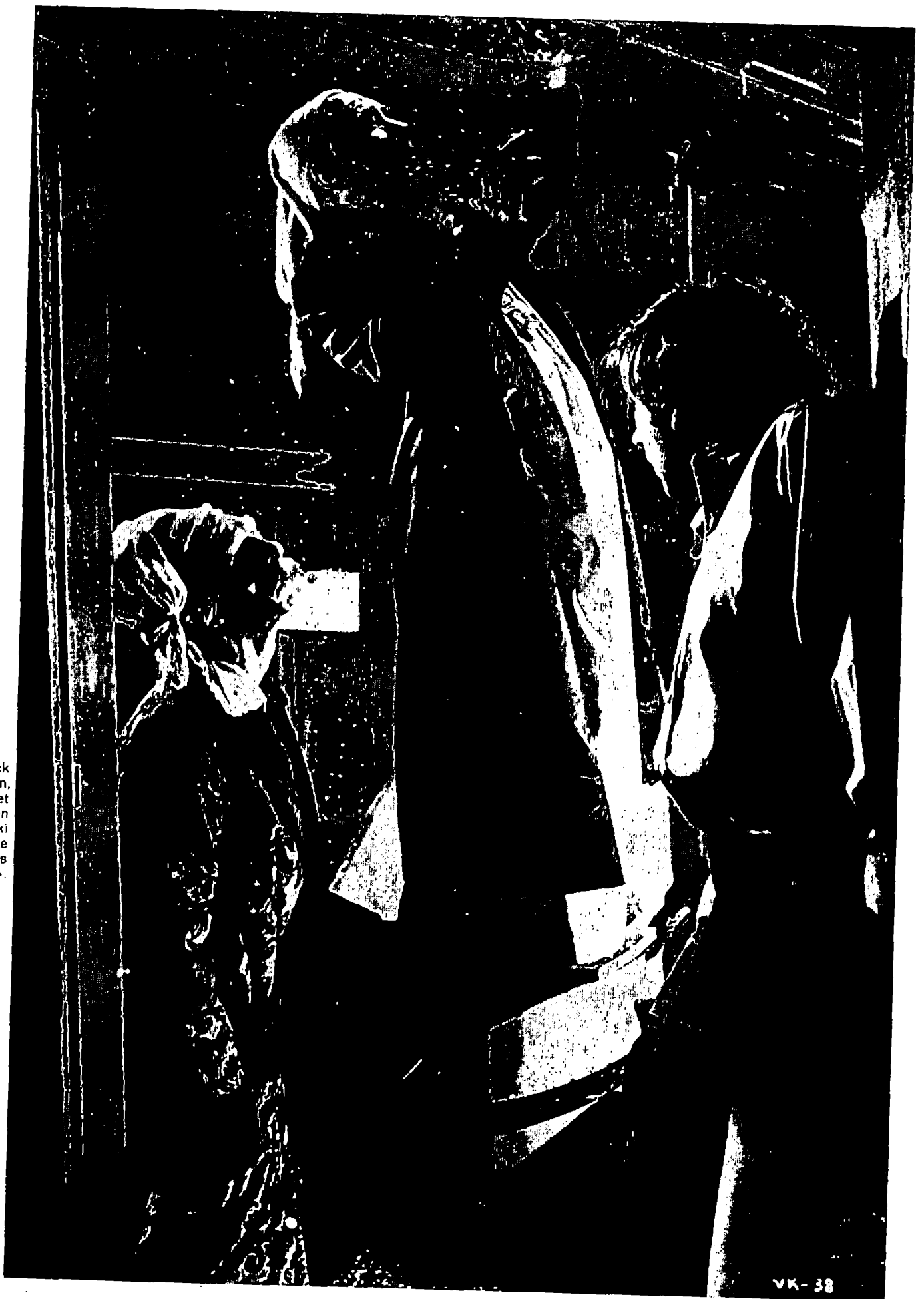
Jack MacGowran, Alfie Bass et Roman Polanski dans « Le Bal des Vampires ».